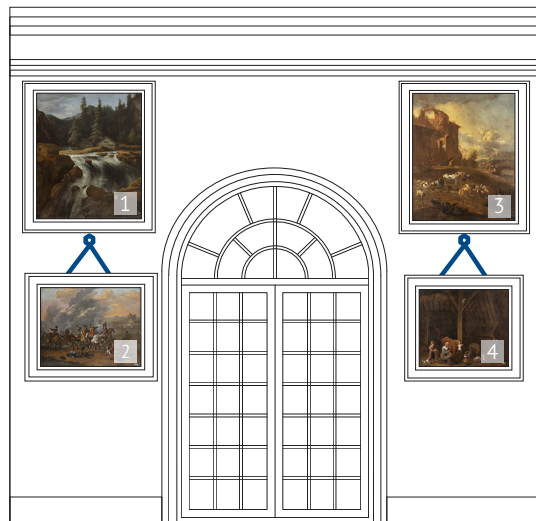
Схема развески картин в Восточном люстгаузе