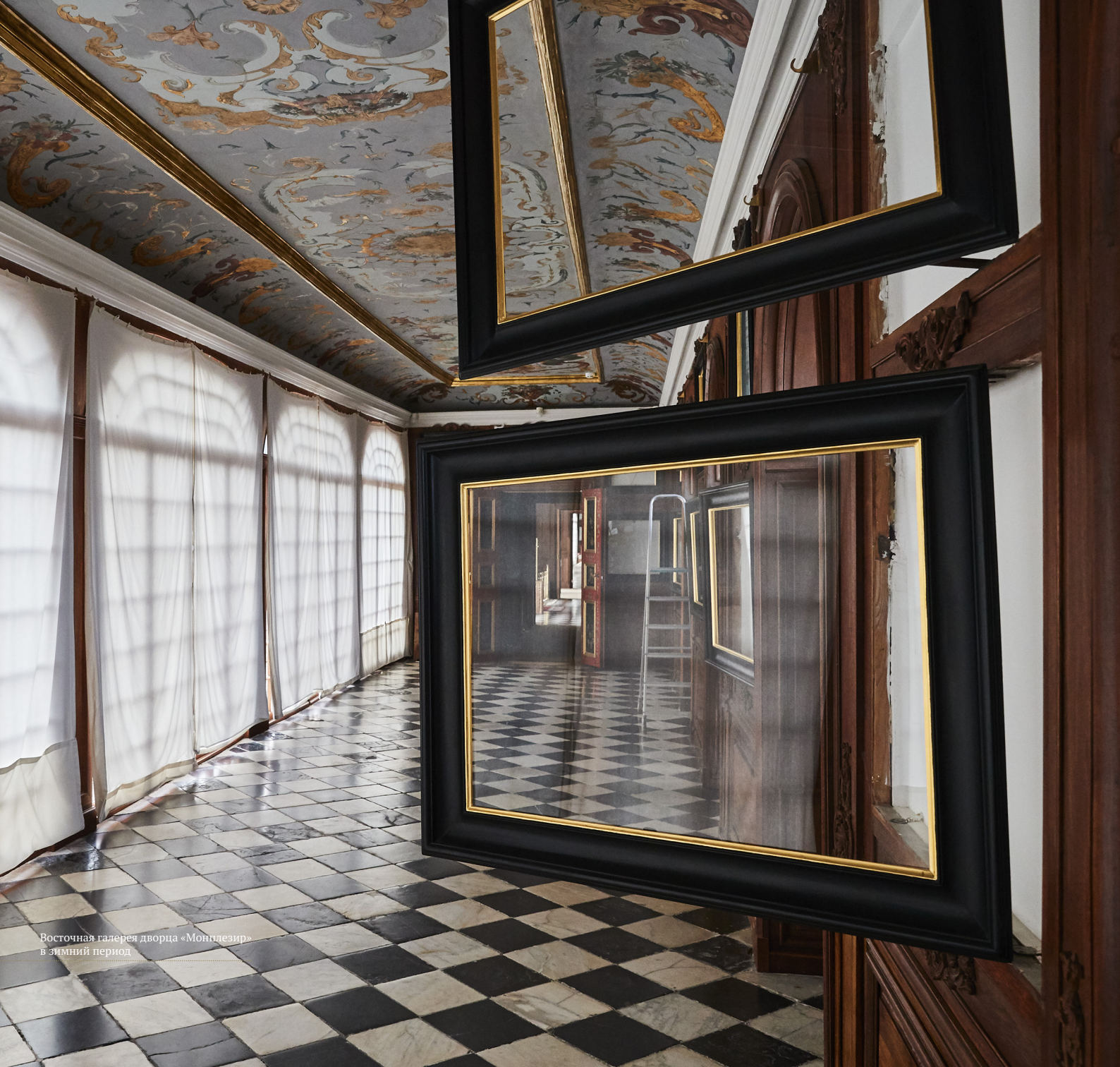
Восточная галерея дворца «Мондлезир» в зимний период