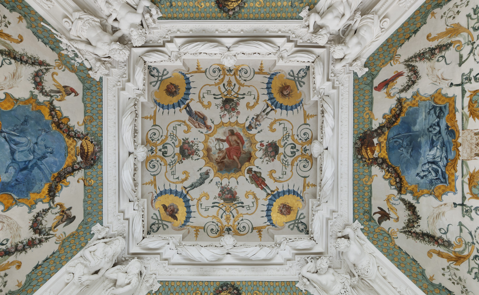
Парадный зал. Живописный плафон и падуги с лепным декором

Потолок на южной и северной сторонах зала плоский, с арабесковыми росписями коврового типа, разделёнными на три части квадратными лепными рамами. В центре плафона, поднятого на высоту 6,8 м, в медальоне изображён бог солнца — властитель светлых сил природы и покровитель искусства Аполлон с лирой. Он окружён корзинами с цветами и четырьмя медальонами с аллегорическими изображениями времён года в виде братьев-ветров (зимнего Борея, весеннего Зефира, осеннего Нота, летнего Эвра); рядом с ним четыре персонажа «Commedia dell'arte» — итальянской комедии масок.